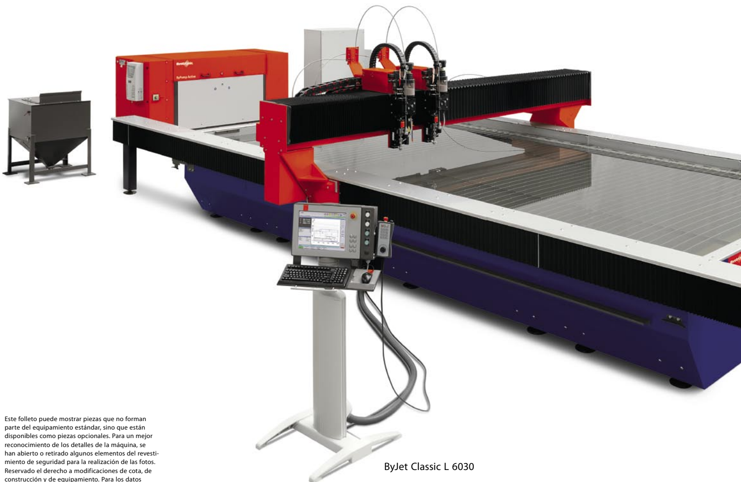
ByJet Classic L 6030

Gracias a la construcción Bystronic de alta calidad de la máquina y a las innovadoras tecnologías de control y propulsión, combinadas con largos años de experiencia en aplicaciones, se logran continuamente resultados de corte de primera clase.